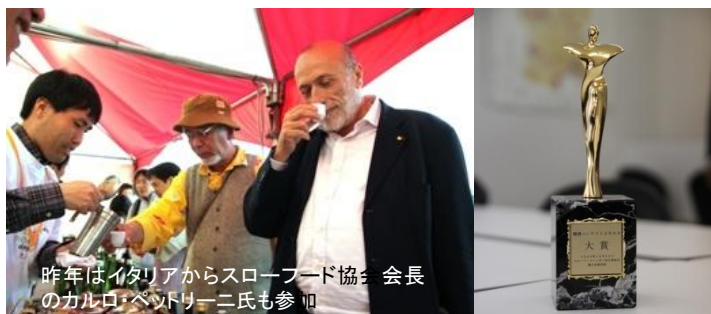
昨年はイタリアからスローフード協会 会長のカルロ・ベッソリーニ氏も参加

SFJ爛酒コンテスト2010金賞酒を味わう会です。コンテストには酒蔵の自信作184点がエントリーし、65点が金賞を受賞。そのうち上位入賞の30社(予定)と、受賞蔵の爛向き未出品酒約100点が一堂に会します。