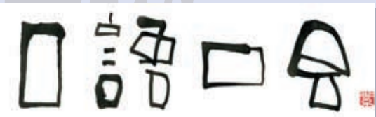
↑アスパラクラブ「紫舟とあなたの一語一会」題字